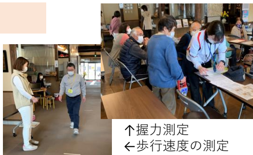
↑握力測定 ←歩行速度の測定

3月9日にシニア健康測定会を実施しました。測定会では、ふくとぴあ健康増進室の健康運動指導士による歩行速度や片足立ち、握力などの体力測定と、認知機能検査のチェックを行いました。測定後には、結果と評価を受け取り、日々の健康づくりに役立つ良い機会となりました。